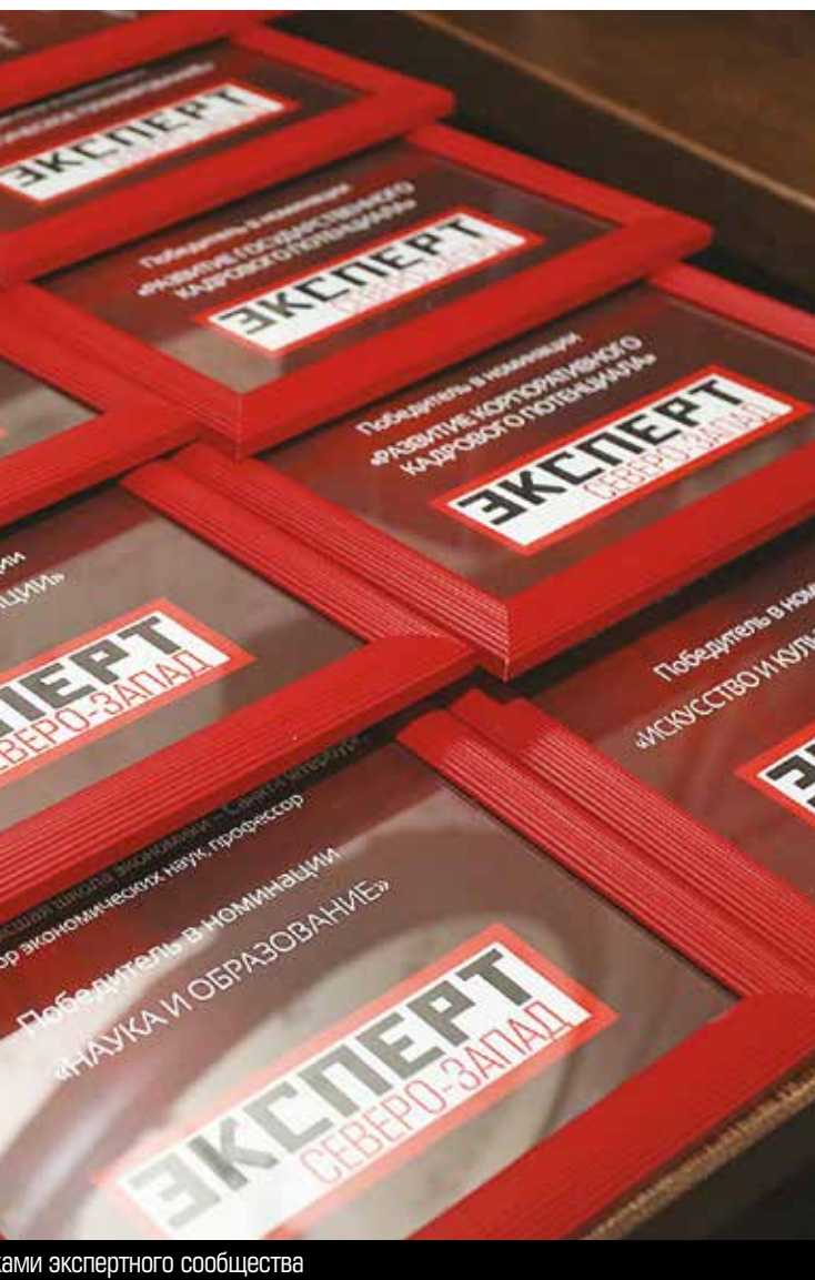
...ами экспертного сообщества