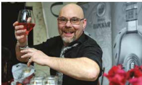
Создатель веселого настроения (компания «Ладога»)