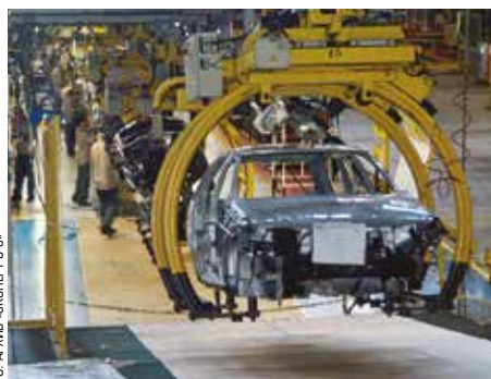
Автоконцерны сокращают производство, чтобы не уйти совсем