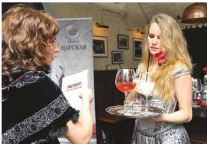
Обязательные представительницы компании «Ладоба», предлагая разнообразные коктейли, помогали гостям церемонии создать правильное настроение

ситуацию мы можем двумя способами. Во-первых, увеличить «частотность» вопроса друг другу: «А какую книгу ты сейчас читаешь?». Это так просто – и так самодостаточно. Вторая идея: тот бюджет, который мы в компаниях тратим на алкогольные подарки по разным праздникам, направить на «лучший подарок» – книгу. Я уверен, это вызовет искреннюю радость у получателей. Очевидно, что человек, который дарит книгу, с интересом и уважением думает о том, кому подарок предназначен».