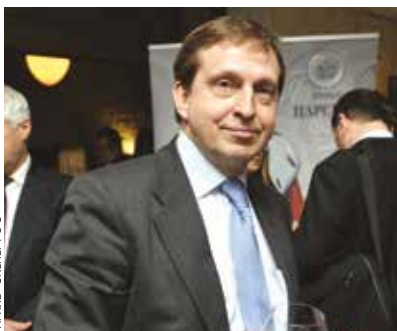
Андрей Черных (Законодательное собрание СПб)